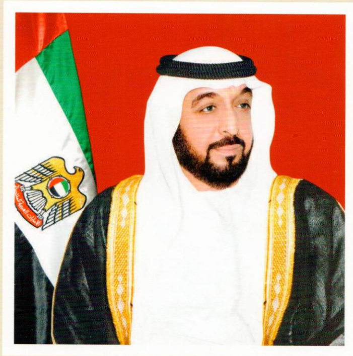
His Highness Sheikh Khalifa Bin Zayed Al Nahyan President of the United Arab Emirates