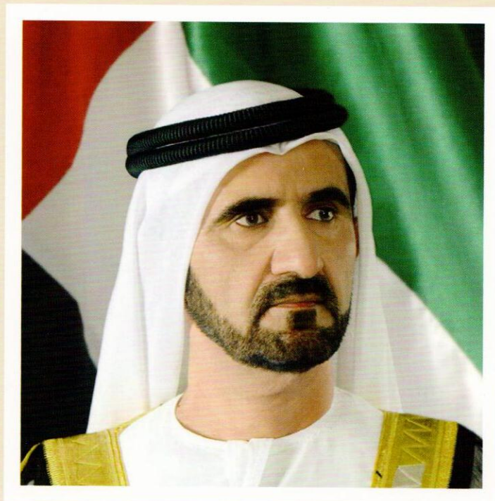
His Highness Sheikh Mohammed Bin Rashid Al Maktoum Vice-President, Prime Minister & Ruler of Dubai