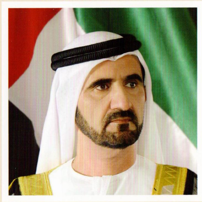
صاحب السمو الشيخ محمد بن راشد آل مكتوم «رعاہ اللہ» نائب رئیس الدولة رئیس مجلس الوزراء حاکم دبي